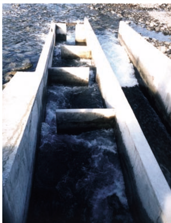
Passé à poissons et délivrance du débit réservé.