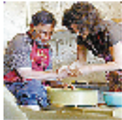
Lieu de pratique artistique