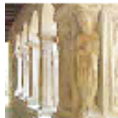
Tourisme de proximité